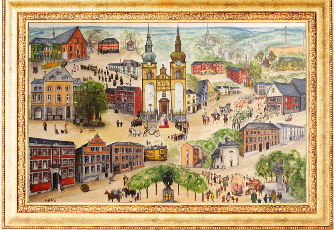
Denise Gilles, Eupen, verschiedene Sehenswürdigkeiten , 1990.