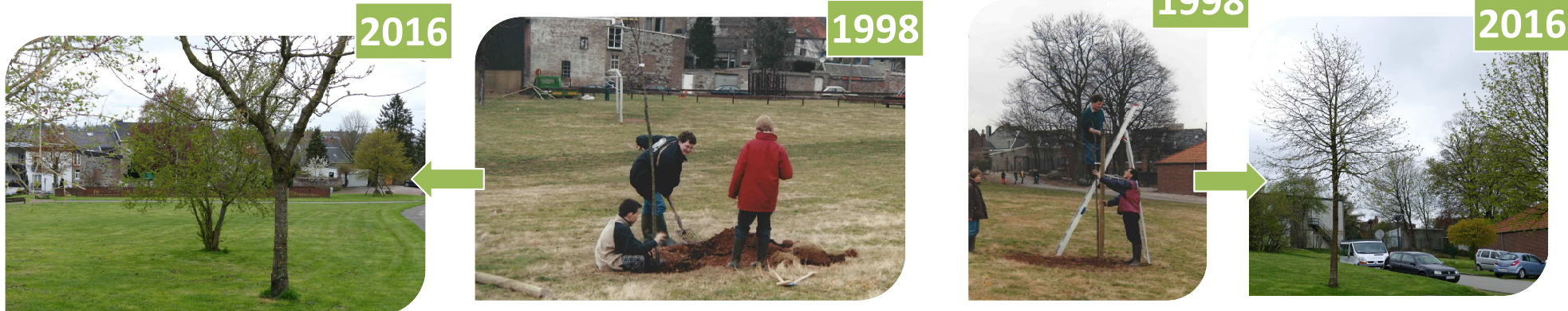
Obstbaum-Pflanzaktion der AVES-Ostkantone in Zusammenarbeit mit der ECEF im Park Loten 1998

Der Kommunale Naturentwicklungsplan, ein Plan mit nachhaltiger Wirkung!