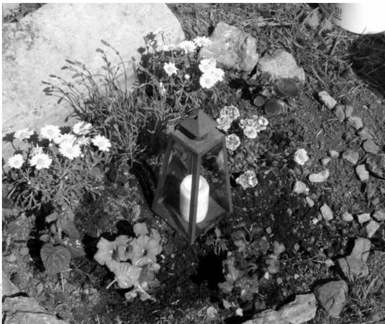
Die Spurengruppe (Kommunionjahrgang 2006)

erkennen oder nicht erkennen. Nachdem wir über Menschen nachgedacht haben, die Gott auf ihrem Lebensweg einen ganz besonderen Platz geben (z.B. Ghandi, Mutter Teresa, Martin Luther King, ...), wollten auch wir uns auf den Weg machen, um »Spuren« in unserer Gemeinschaft zu hinterlassen. Mit Bollerwagen, Schaufel, Spaten, Eimer, frischer Erde, Pflanzen, Blumen, Hacke und ganz viel GUTER LAUNE haben wir an einem wunderschönen Mittwochnachmittag das Wegekrenz am Kalkofen verschönert. Dabei haben wir viel gelacht und geschwitzt. Schaut es Euch doch mal bei einem Spaziergang an! Vielleicht brauchen die Blumen ein wenig Wasser, und somit streut auch Ihr den Samen Gottes in die Welt hinaus.