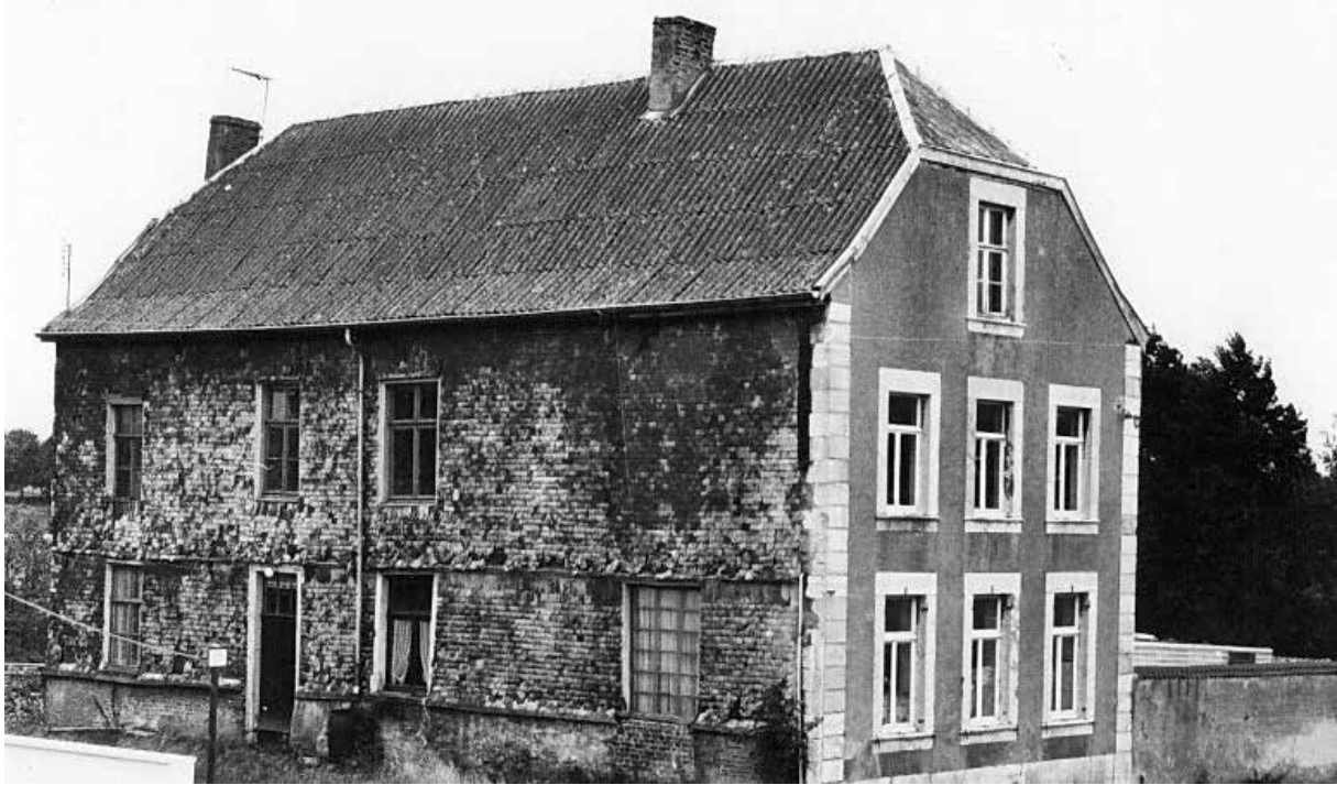
Das Herrenhaus de Grand Ry auf Buschberg