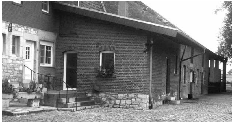
Hier befand sich einst die Rampe zum Abladen der Milchkannen

Bekanntmachung: Durch einstimmigen Beschluss der Generalversammlung obiger Molkereigenossenschaft vom 17. Juni wurde die Genossenschaft aufgelöst. Sämtliche Gläubiger