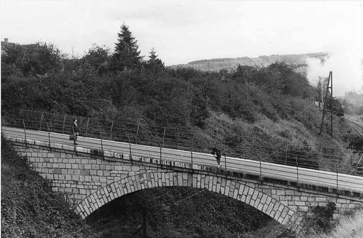
Die alte Bahnbrücke Heidgasse zur Obersten Heide

N.B. Für die Besucher des unteren Stadtteils werden wir unsere Autos in Betrieb setzen. Bedingung: jeder, der mitfährt, muss in der Lebensversicherung sein.