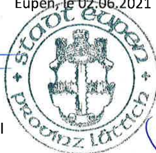
Claudia Niessen Bourgmestre

En raison de la crise actuelle du Covid-19, les informations concernant le dossier peuvent être obtenues par téléphone ou par mail.